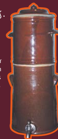
Cafetière en grès utilisée par les collectivités