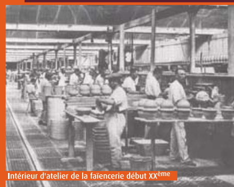
Intérieur d'atelier de la faïencerie début XX ème