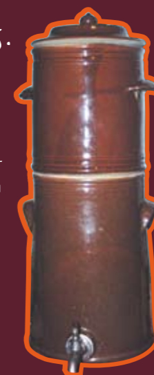
Cafetière en grès utilisée par les collectivités