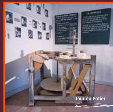
Tour du Potier

Au travers des collections et des oeuvres de céramique exposées, c'est au savoir-faire et au travail des faïenciers digoinois que l'on rend hommage.