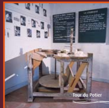
Tour du Potier

Au travers des collections et des oeuvres de céramique exposées, c'est au savoir-faire et au travail des faïenciers digoinois que l'on rend hommage.