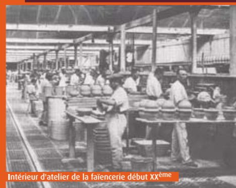
Intérieur d'atelier de la faïencerie début XX ème