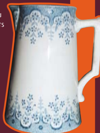
Pichet forme parisienne